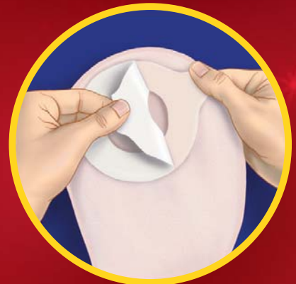
3. Lepljiv obroč na vrečki