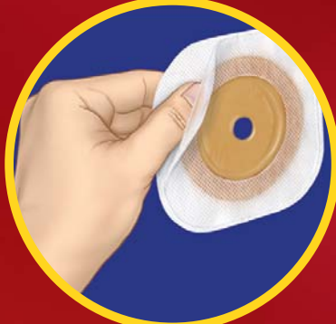
2. Področje lepljenja (stran proti vrečki)