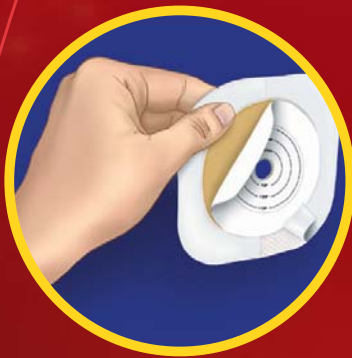
1. Zaščitni papir kožne podloge (stran proti telesu)